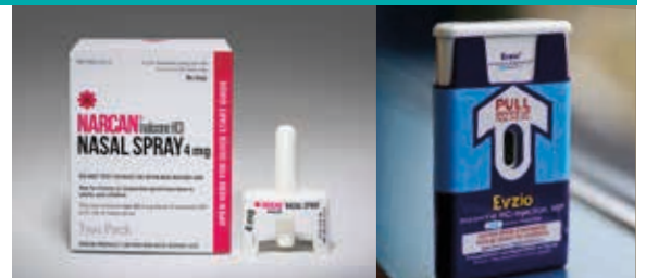
Các ví dụ về Naloxone.

Naloxone có thể cứu sống một người khỏi tình trạng sử dụng quá liều các loại thuốc giảm đau thuộc nhóm opioid. Thuốc sẽ bắt đầu có tác dụng trong vòng hai (2) đến ba (3) phút. Thuốc được cung cấp dưới dạng chai xịt (hình ảnh bên trái) hoặc thiết bị tiêm (hình ảnh bên phải), cả hai dạng này đều dễ sử dụng.